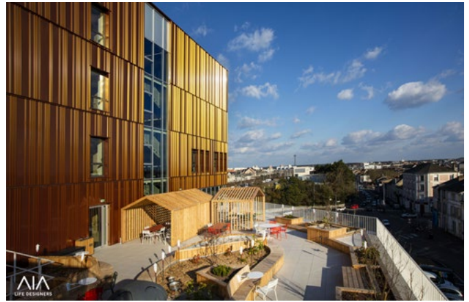
▲ Terrasses végétalisées et aménagées