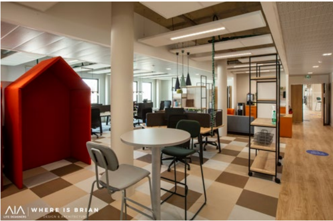
▲ Espace détente