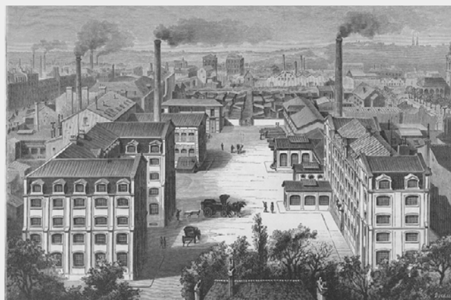
▲ Vue de la Manufacture, rue de Flandre.