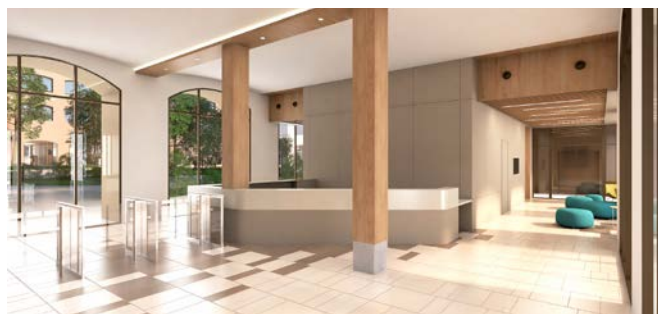
▲ Hall d'accueil.