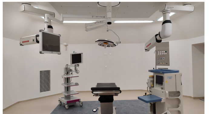
▲ Bloc opératoire