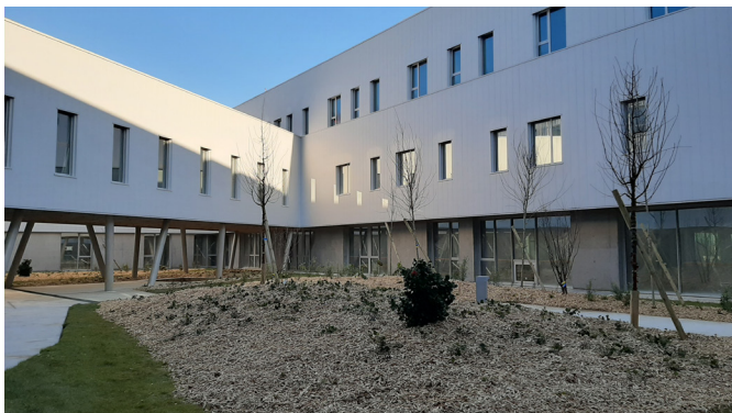
▲ Patio intérieur