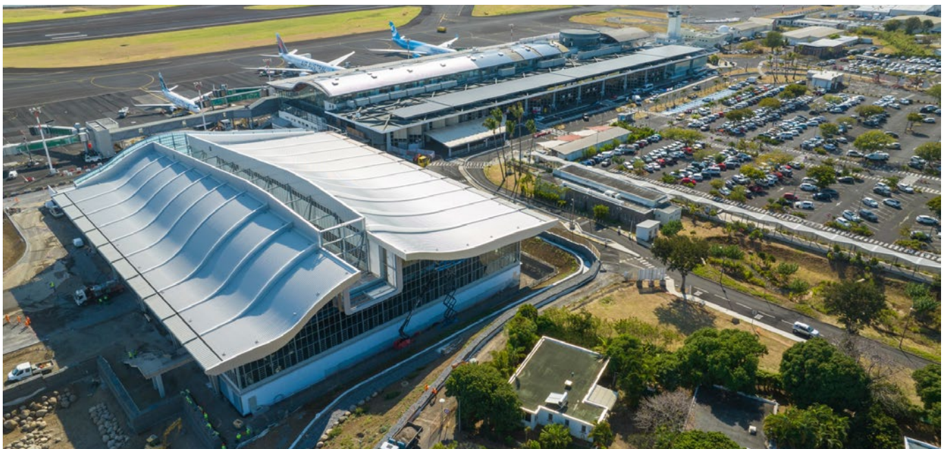
▲ Vue aérienne