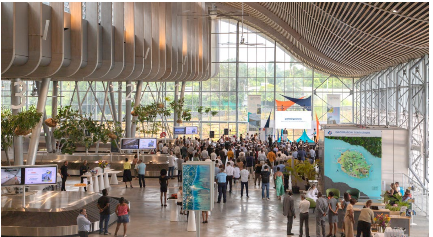
▲ Inauguration de l'extension - 15 mars 2024