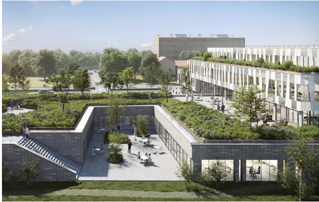
Parcours végétalisé et patio du RIE