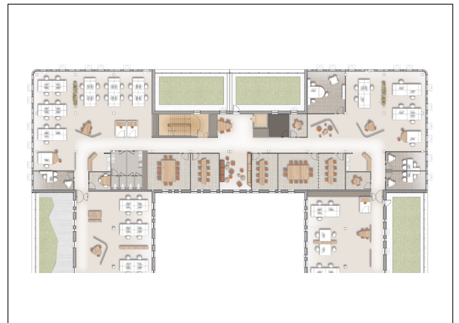
Plan du R+2 (zoomé)