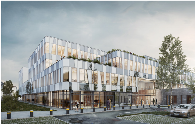
Vue depuis le parvis