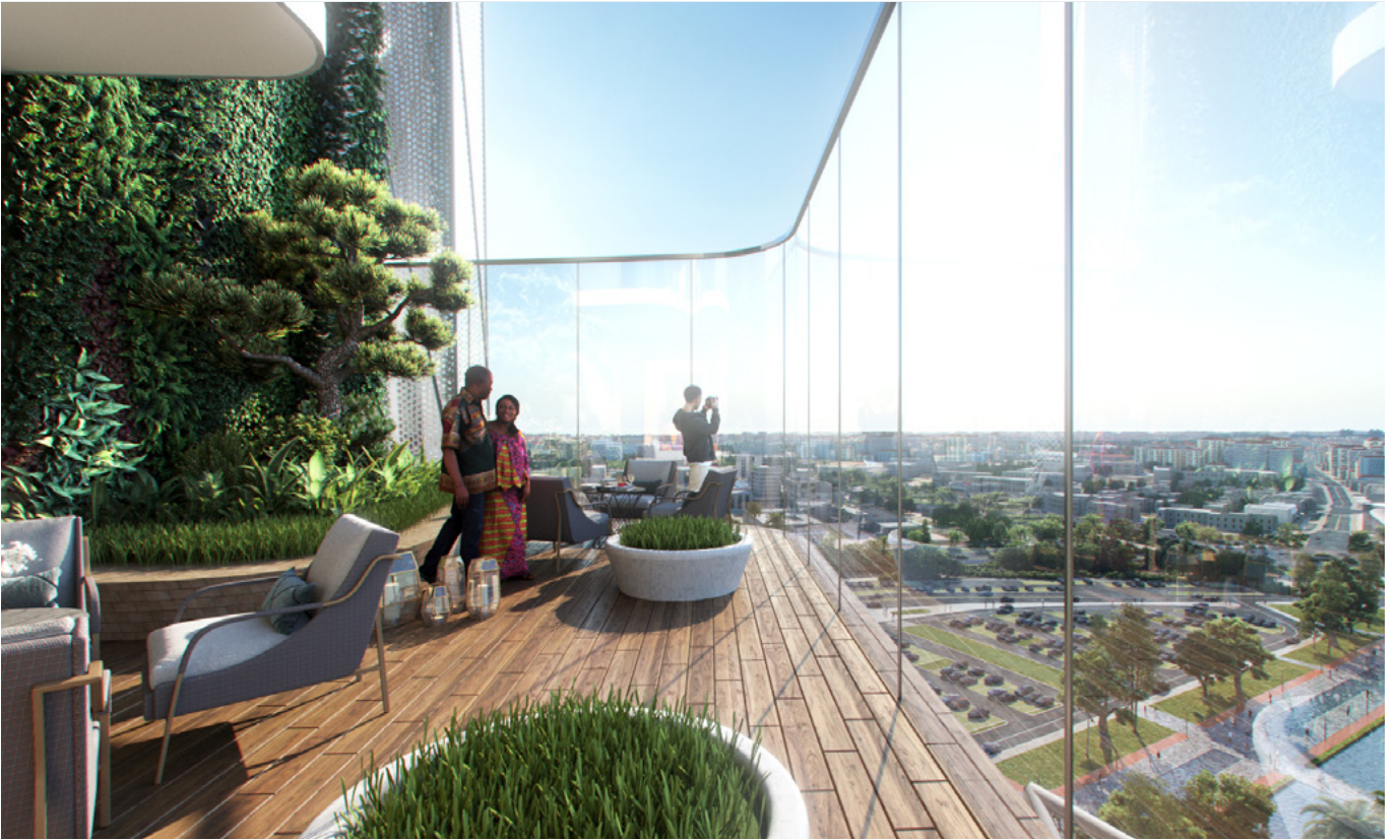
▲ Terrasse intérieure